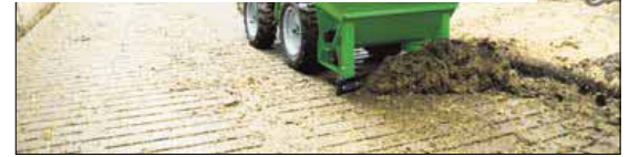
En ny strøkkasse fra Avant Danmark kan klare flere arbejdsopgaver på én gang. Blandt andet kan der monteres en skraber, som klarer rengøringen af spalter og gangarealer.

På strøkkassen kan monteres et desinfektionsanlæg, som arbejder uafhængigt af selve strøkkassen, og kan doseres efter behov. Samtidig kan der monteres en skraber, som klarer rengøringen af spalter og gangarealer, mens Avant strøkkassen også giver mulighed for montering af en hydraulisk kost, der sørger for rengjorte sengebåse, alt imens der kastes halm ud - fire opgaver på én gang.